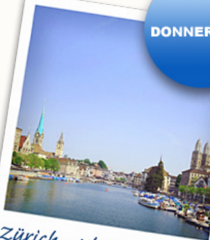
Zürich - Kleinod am see