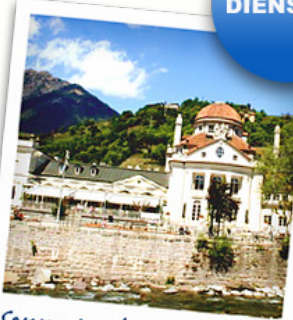
Sonne tanken in Meran