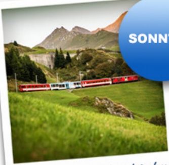
Matterhorn Gotthard Bahn