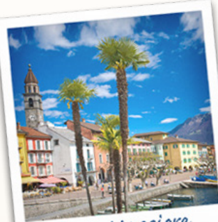
Lago Maggiore Sehnsucht?