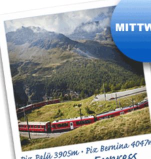
Piz Palü 3905m · Piz Bernina 4047m Bernina Express