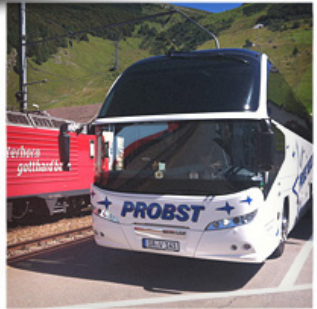
+ Probst = unvergesslich!