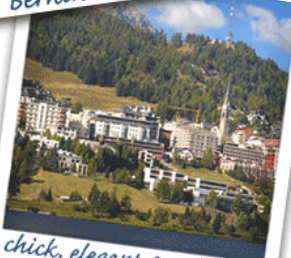
chick, elegant & exklusiv St. Moritz